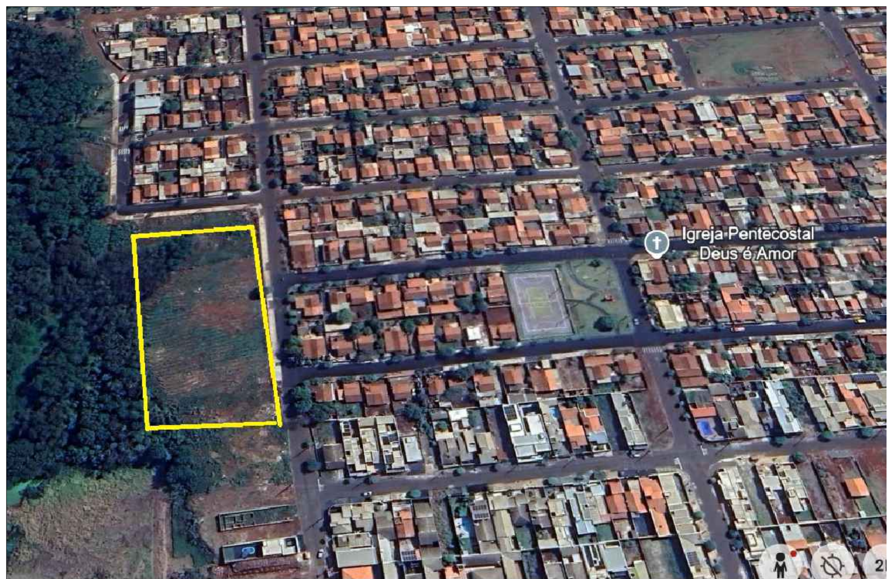
Local da obra - Imagem google SEM ESCALA